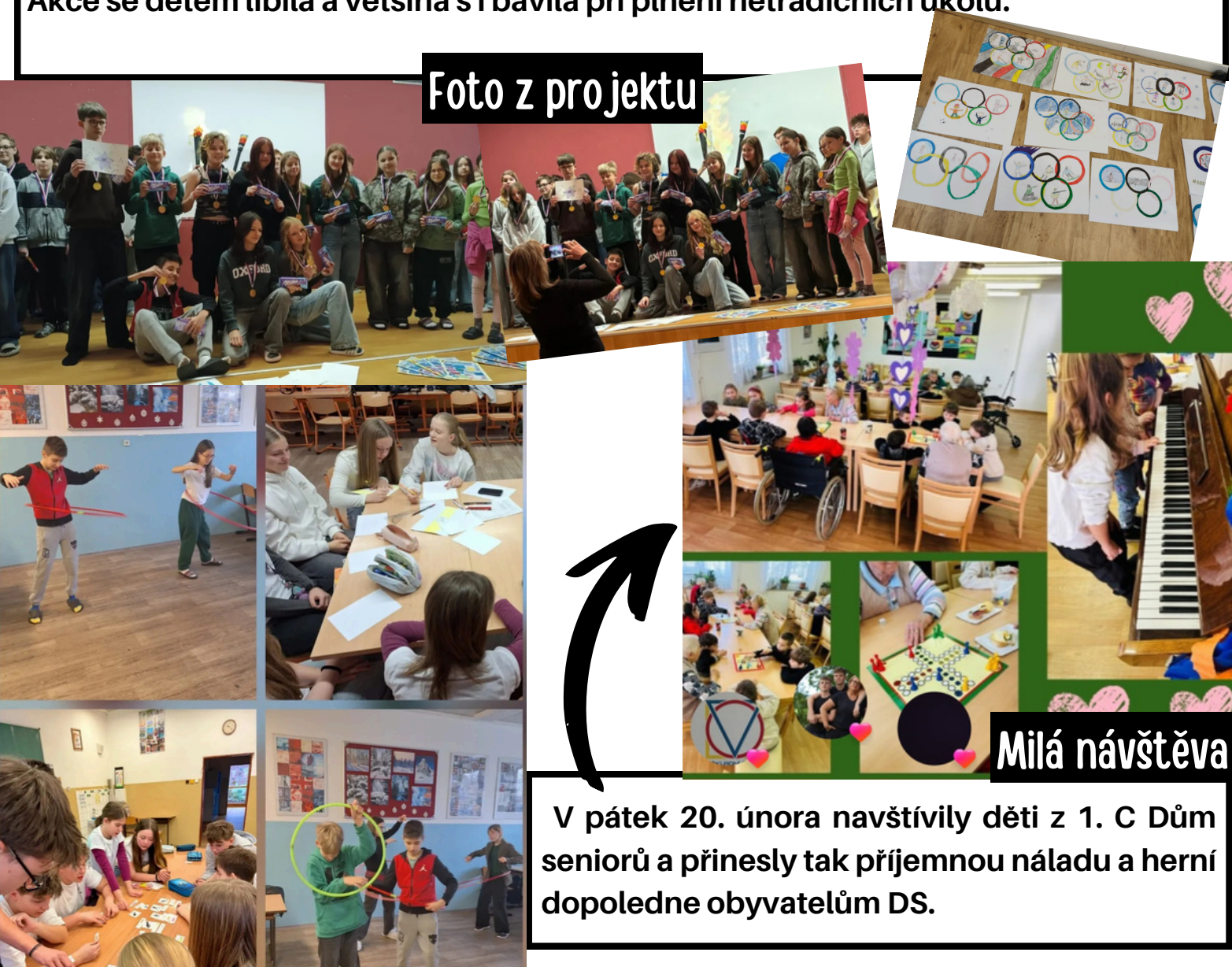
Foto z projektu

Při samotné realizaci projektu se třídy druhého stupně rozdělily dle vytvořených rozpisů do 11 skupin po asi 12 dětech, vždy jeden až dva z jedné třídy - museli tak spolupracovat i ti, kteří by se jinak nesečkali při společné činnosti. Postupně pracovali na jednotlivých stanovištích, kde získala skupina body pro závěrečné hodnocení. Skupiny jsou motivovány i možným umístěním v projektovém dni. Akce se dětem líbila a většina s i bavila při plnění netradičních úkolů.