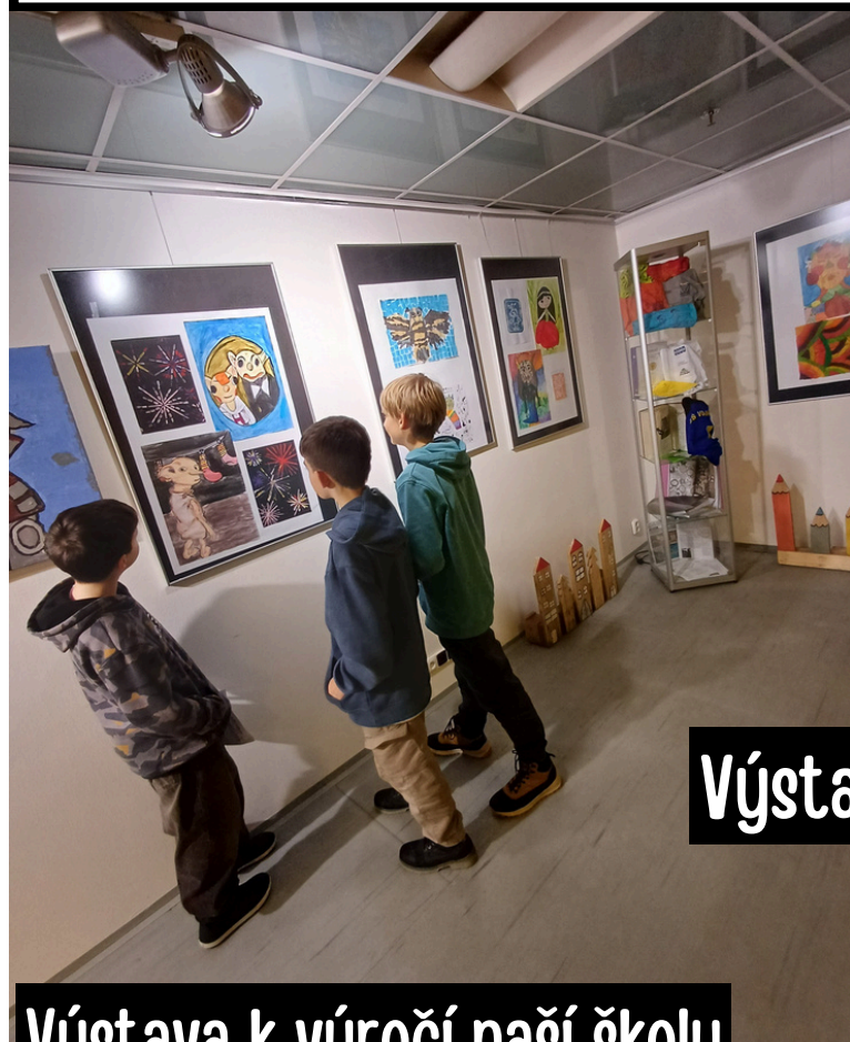
Výstava v Infocentru

Tříkrálová sbírka přináší pozitivní náladu do ulic a měst. Desetitisíce dobrovolníků vyrážejí do obcí a měst, aby pomáhali lidem v nouzi. Přispět však můžete nejen při koledování, ale během celého roku.